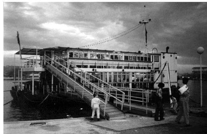
La Isla del copyright. Portugalete, 1995

Los eventos del día grabados por Beckett Gookin se retransmitirán en directo en www.copilandia.org .